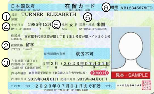
在留カード例（表面）