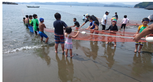
地引網 (家族参加型)

職員同士の交流を深めるために毎年1回社員旅行をしています。海外、国内、日帰り旅行、地引網、野球観戦などライフスタイルにあわせて選ぶ事ができ、今年はハワイ、香港、U S J、滋賀すきやきツアーなどを実施しています。また、勤続20年を迎えた職員については病院が旅費を全額負担する制度があり、ご当地のグルメを堪能したり、日頃の疲れを癒したりして、ストレスの解消や心身のリフレッシュ、円滑なコミュニケーションを図れるようにしています。