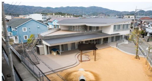
院内保育所の全景

仕事と子育て両立支援のために、0歳から就学前までのお子様をお預かりする保育施設があります。2016年に病院隣接地に新築移転し、職員の経済的負担を軽減するために福利厚生の一環として運営しています。また、職員以外の乳幼児を受け入れる地域枠や企業枠などもあります。明るい園庭と広い室内遊戯室があり、晴れた日も雨の日も子供たちがのびのびと遊ぶ事ができ、職員が安心して仕事に集中できる環境づくりを進めています。