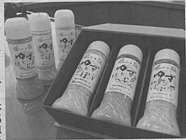
徳島産のユズに野菜を組み合わせたドレッシング

ッシングとユズの組み合わせを試行錯誤し、青パパイア、ゴボウ、ニンジンなどの3種類を商品化した。